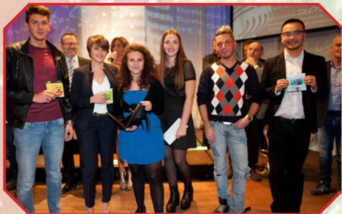
I VINCITORI DELLA GOCCIA D'ORO