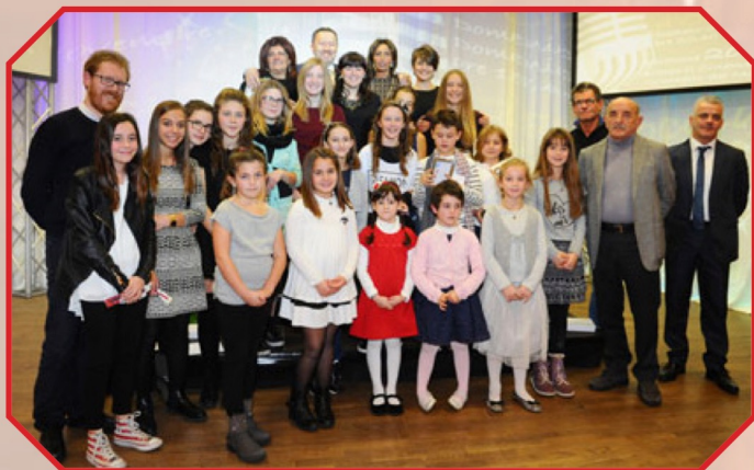
I VINCITORI DEL GRAPPOLO D'ORO