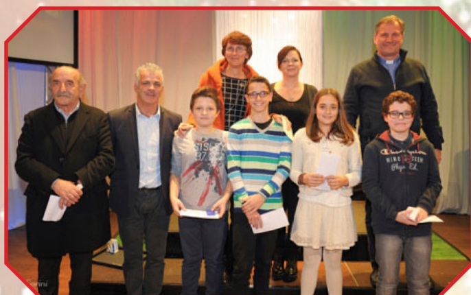
I VINCITORI DEL PREMIO DON GEREMIA ROTA