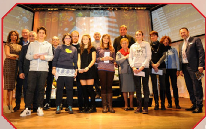
I VINCITORI DEL PREMIO DON ZILIOOTTO