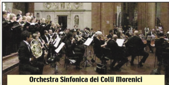
Orchestra Sinfonica dei Colli Morenici